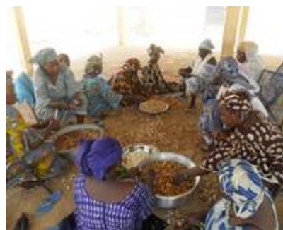
Tri des noix de Karité

Parmi les groupes démunis, 17 Associations Féminines sont financées pour la mise en œuvre d'Activités Génératrices de Revenus