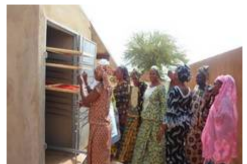
Séchage des tomates

La formation à la transformation et à la commercialisation des produits locaux permet aux femmes de développer leur commerce sur les marchés