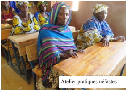
Atelier pratiques néfastes

Des séances d'information et de plaidoyer sont organisées auprès des enseignants et des autorités locales : responsables communaux, chefs religieux et traditionnels.