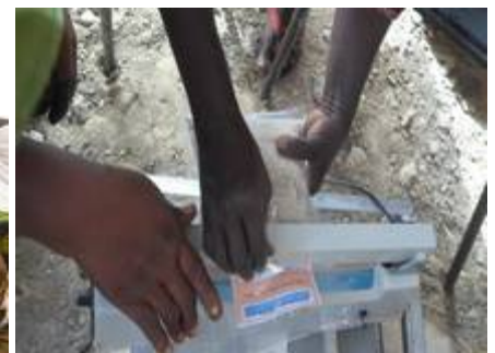
Ensachage des produits