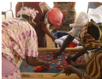
Préparation au séchage des tomates

Des formations aux techniques de préparation, de séchage, de conservation et d'étiquetage des produits sont dispensées.