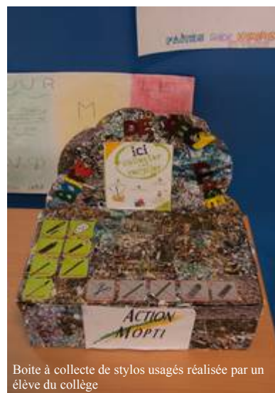
Boîte à collecte de stylos usagés réalisée par un élève du collège

D'autres élèves et d'autres enseignants les ont rejoints dans cette dynamique solidaire comme le Lycée Descartes ou le collège Ariane, entraînant aussi des classes primaires. Ainsi une partie des habitants de Saint Quentin en Yvelines est engagée dans des actions de solidarité qui, cette année, vont permettre d'équiper une école maternelle de la région de Mopti, selon les besoins repérés par l'équipe Education de Mopti.