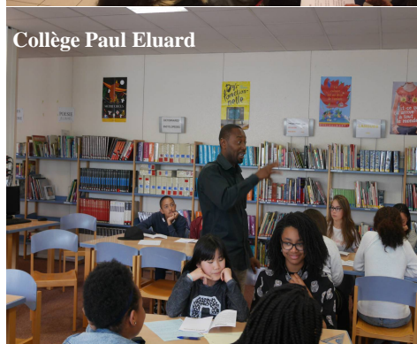
Collège Paul Eluard