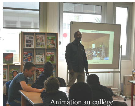
Animation au collège

« L'accueil chaleureux et la joie manifestée par toute l'équipe du siège pour ma venue ont été de bon augure pour le bon déroulement de la mission. »