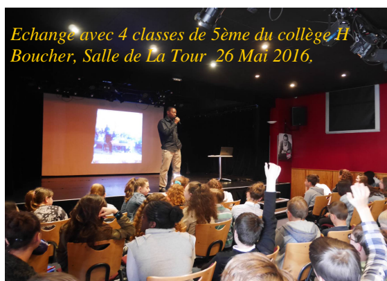
Echange avec 4 classes de 5ème du collège H Boucher, Salle de La Tour 26 Mai 2016.